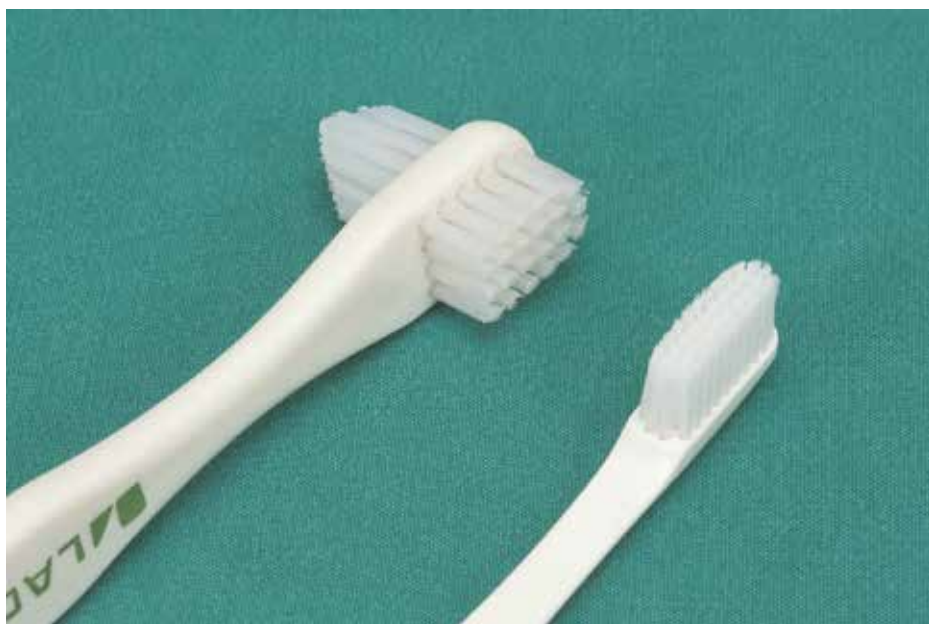
Protheseborstel (links) en handtandenborstel

Haal het tandsteen niet weg met een scherp instrument zoals een mesje. Ook dit geeft krassen waar vuil in gaat zitten.